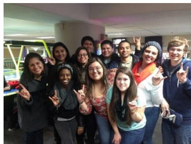
Miembros de ULI conviviendo después de un entrenamiento