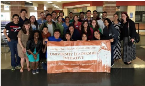
Voluntarios después de un taller donde ayudamos alrededor de 20 DREAMers a aplicar para DACA

El equipo de DACA & DAPA presenta sesiones informativas para informar a la comunidad acerca de los programas y presentarles las ultimas noticias relacionadas. Además, también tienen talleres gratuitos para ayudar a la comunidad a aplicar para estos programas.